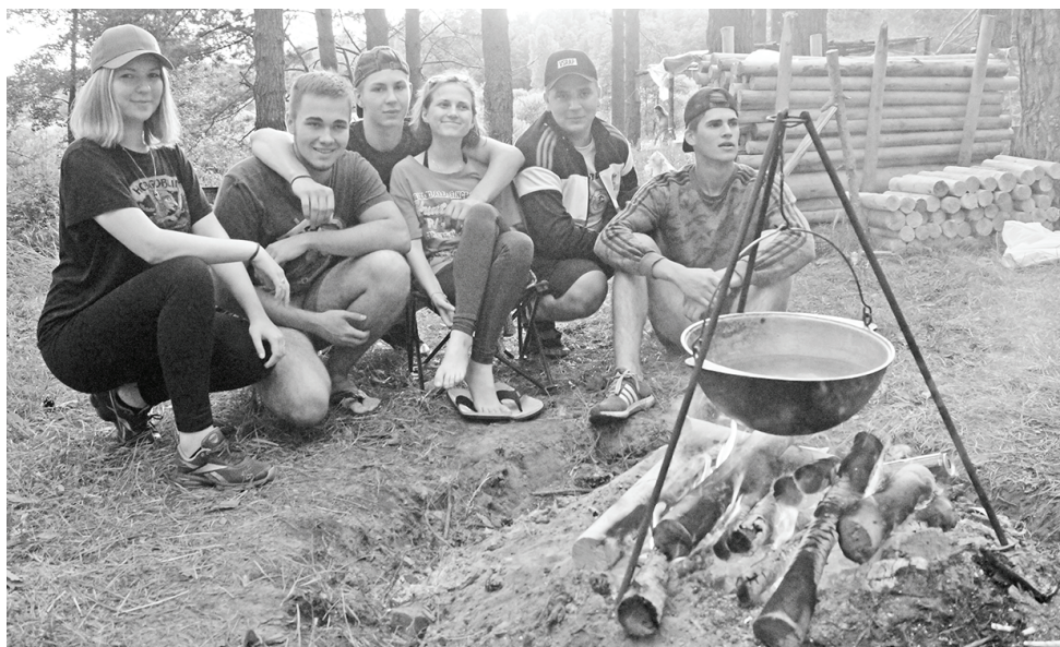
«Якутянская семья» возле своего очага.