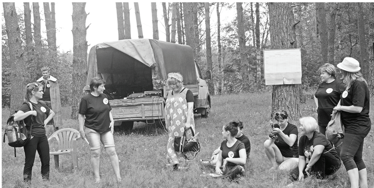
«Мы - Бродячие артисты».