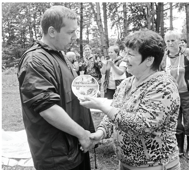
«Привет из Думиничей» - «Козельску-2017». На добрую память.