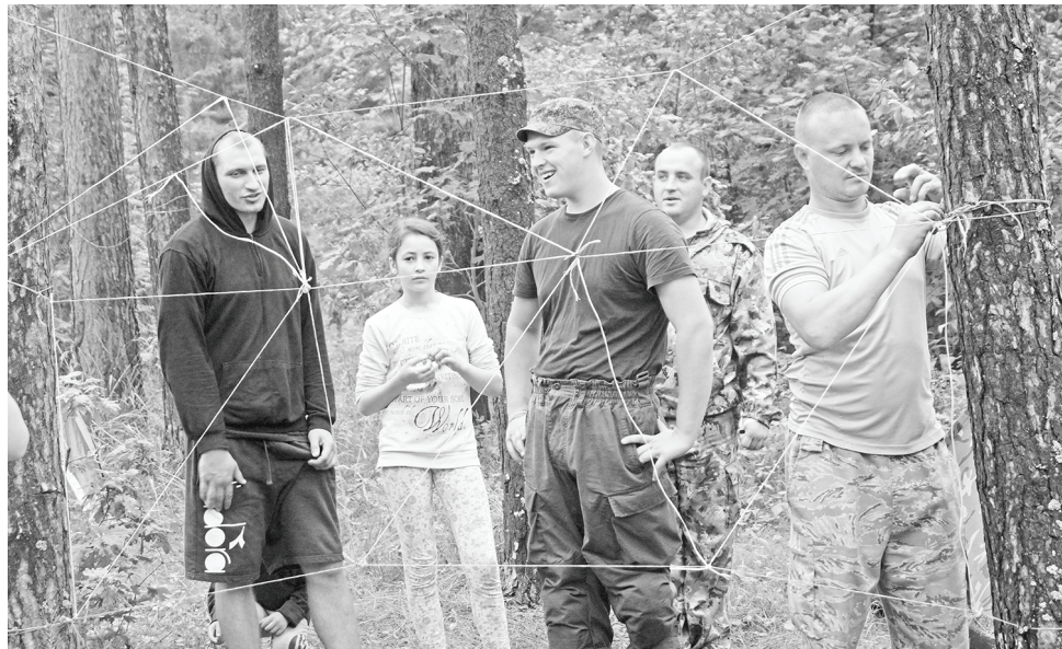
«Богатыри» и «Паутина».