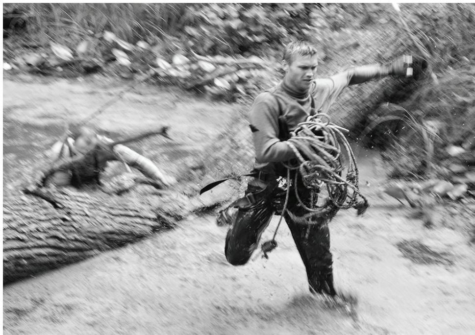
ТПТ. Болото. «Мы в такие шагали дали, что не очень-то и дойдешь...»

28-30 июля на «центральной туристической базе» нашего района - чернышенских Ключах – «на ура» прошел традиционный турслет, посвященный годовщине освобождения думиничской земли от немецко-фашистских захватчиков.