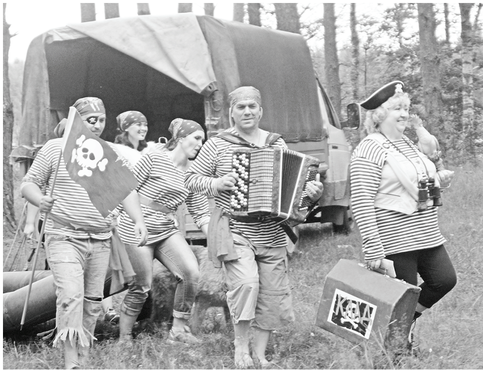
Пиратская «Визитная карточка» победителей турслета-2017 команды «Клад».