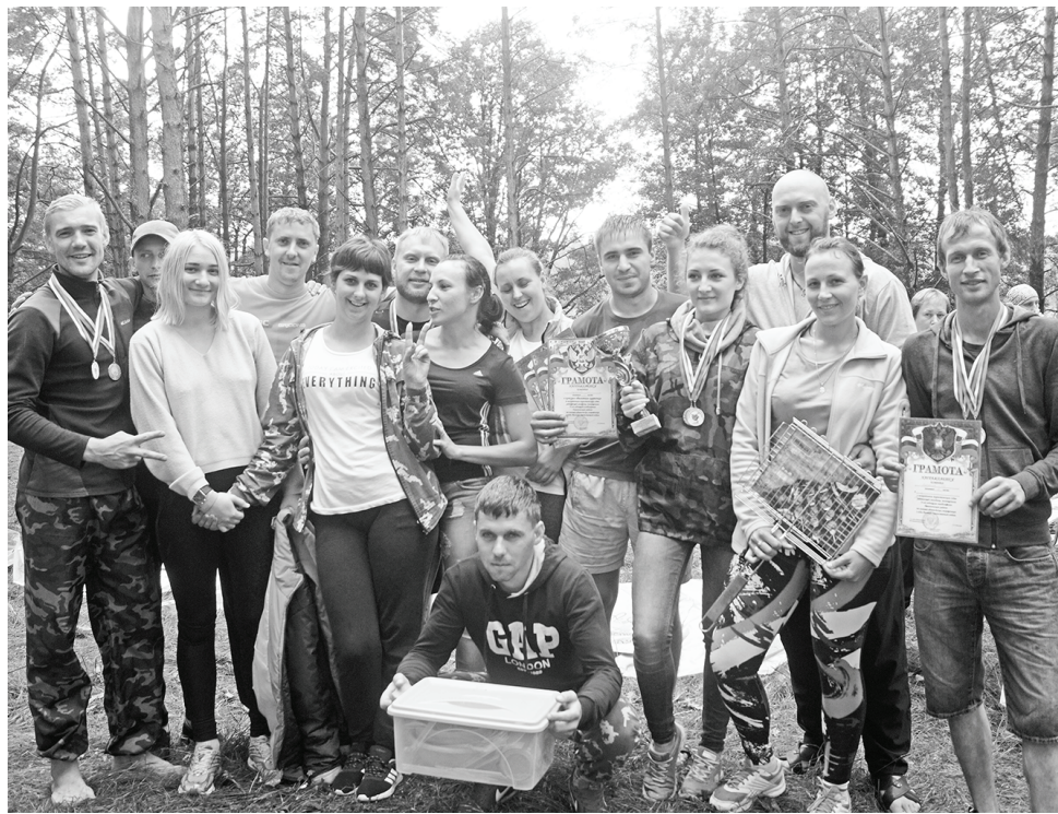
Серебряный «Восток-45». Ребята завоевали 2 место.